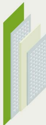
Gesamtdicke der Klebstoffschichten ohne Adeckungen ca. 220 µm